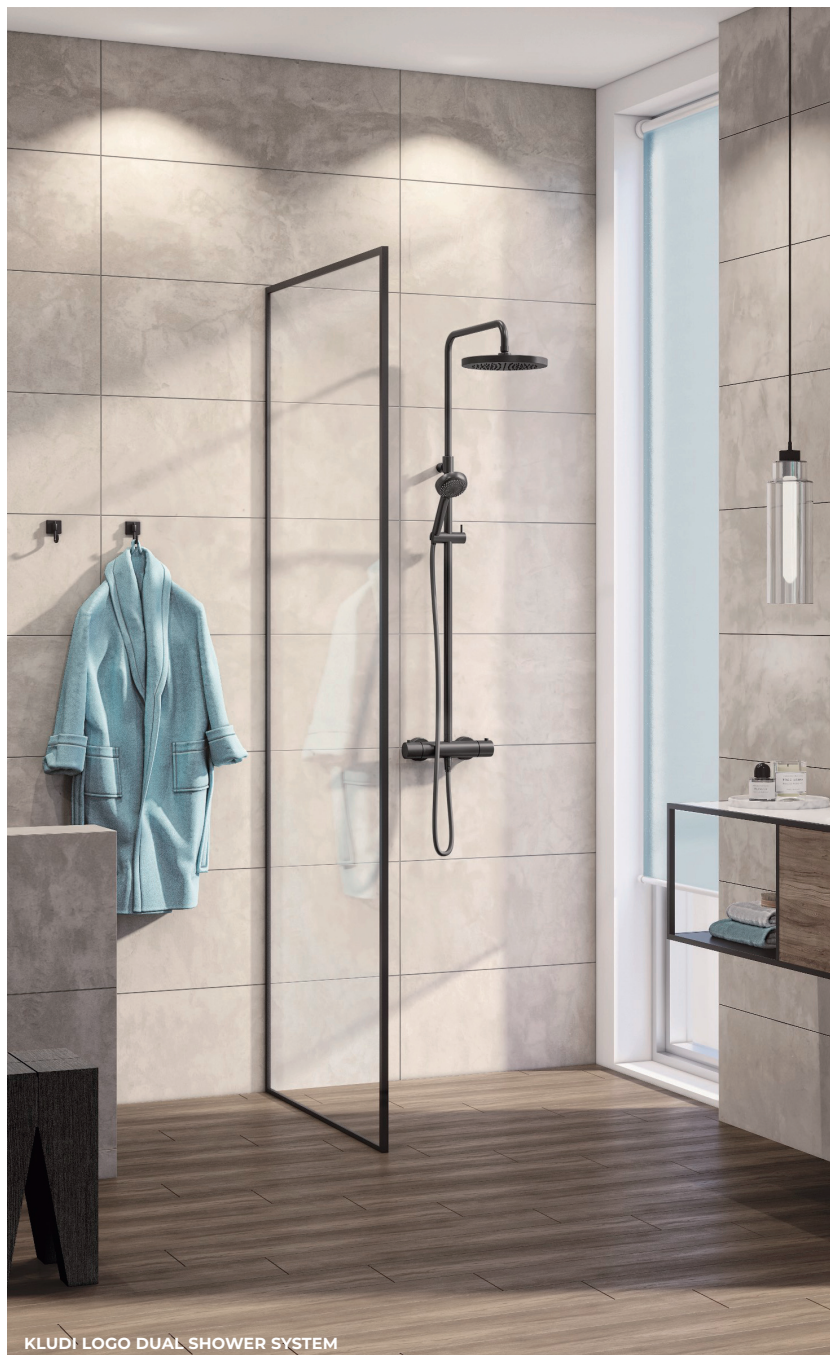
KLUDI LOGO DUAL SHOWER SYSTEM