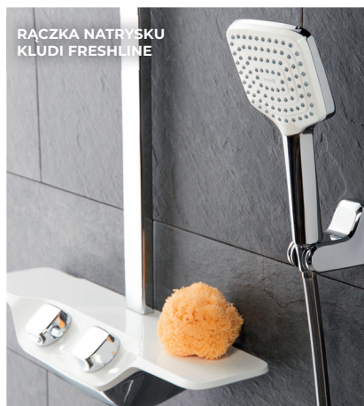
RĄCZKA NATRYSKU KLUDI FRESHLINE

Inną propozycją, szczególnie dedykowaną miłośnikom wymakowanego designu jest system natryskowy KLUDI COCKPIT Discovery . Jego znaki rozpoznawcze to minimalistyczna forma, opływowe kształty oraz wysoka funkcjonalność. Zestaw ten