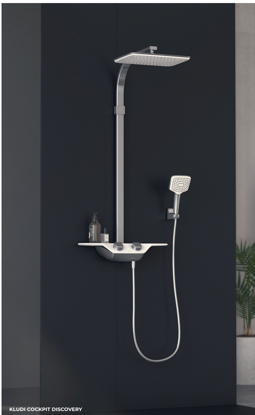
KLUDI COCKPIT DISCOVERY

stanowi uniwersalne rozwiązanie dla każdego – bez względu na wiek czy możliwości ruchowe. Obsługa zestawu jest wygodna i intuicyjna, a odpowiada za to specjalnie zaprojektowany panel sterowania pochylony w kierunku użytkownika pod kątem 40°. Głowica górna została zaprojektowana w taki sposób, aby strumień obejmował całe ciało, a duże pokrętki pozwalają na łatwą obsługę. Zaokrąglone krawędzie, delikatna forma i lekki kształt przekładają się na ergonomię – możliwość instalacji nawet w niewielkich łazienkach. Dodatkowo, sys-